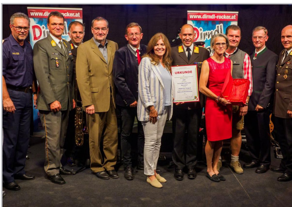
140 Jahre FF Mannsdorf/Donau

Das Kommando der Freiwilligen Feuerwehr Mannsdorf/Donau.