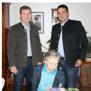
Zum 85. Geburtstag