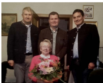
Zum 85. Geburtstag