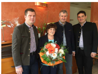
Zum 80. Geburtstag