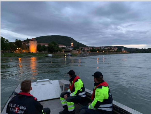
Nachtfahrt nach Hainburg